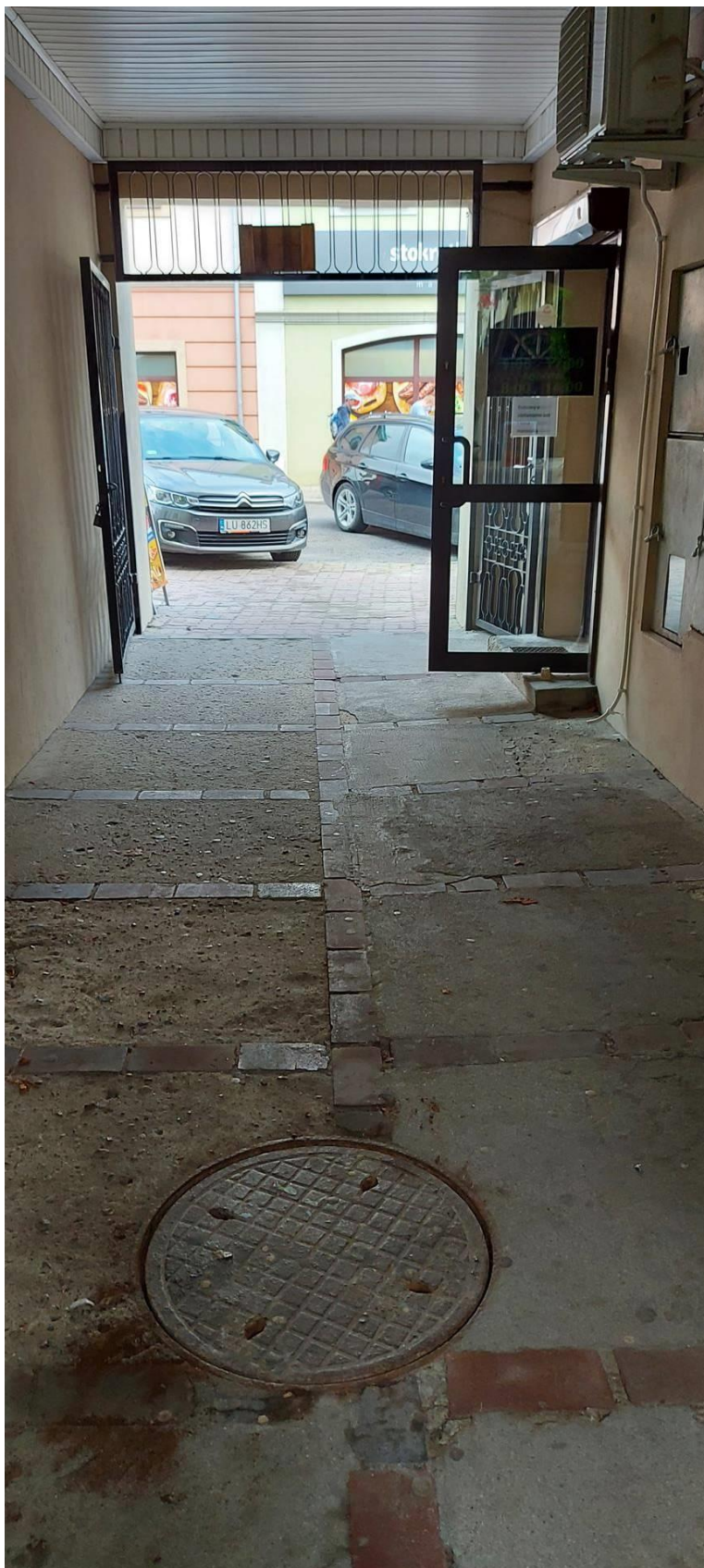
Foto 6. Miejsce awarii ul. Czysta w Krasnymstawie