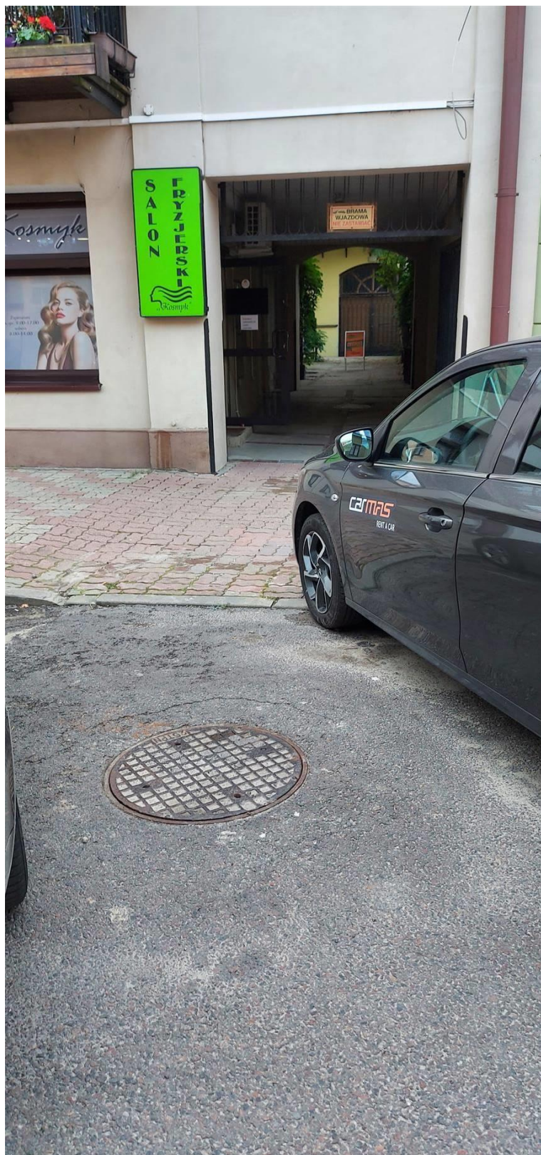
Foto 2. Miejsce awarii ul. Czysta w Krasnymstawie